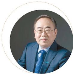
刁志中 DIAOZHIZHONG 建筑工程专家 广联达董事长